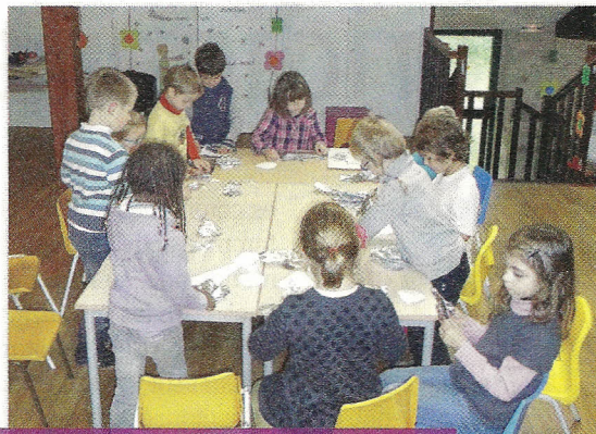
A l'école de Flavignac, les enfants ont découvert l'artiste Alexandre Calder.

Concrètement, les 444 enfants de ce territoire du Limousin vont en TAP deux après-midi par semaine. Ces activités gratuites sont assurées soit par le personnel communal ou par des intervenants extérieurs, à travers des ateliers d'initiation à l'anglais, la musique, la danse... soit par les animateurs qualifiés dépendant de l'ALSH qui interviennent de 45 minutes à 1h30 par semaine dans chaque classe. Avec des activités calmes en début