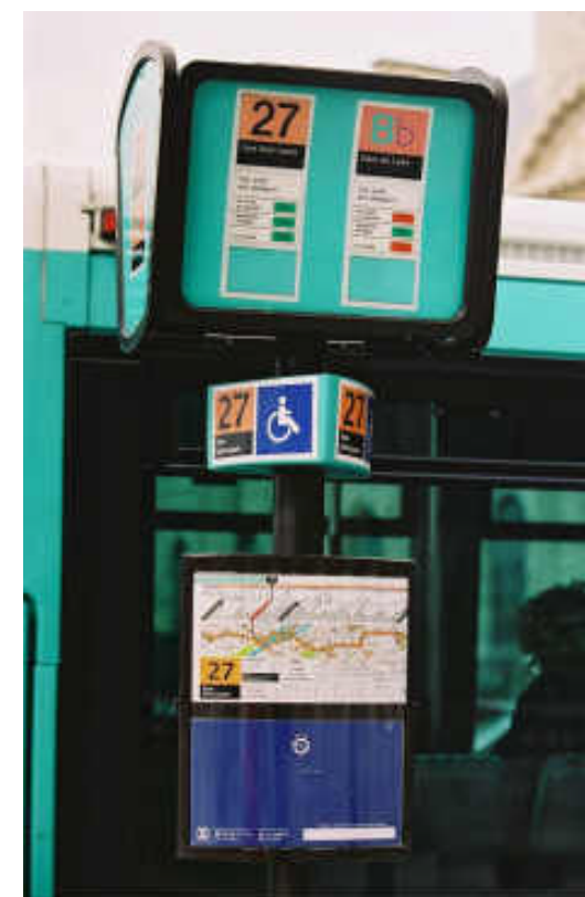
© RATP - Mauboussin Jean François 2006/22 - 21/02/2002